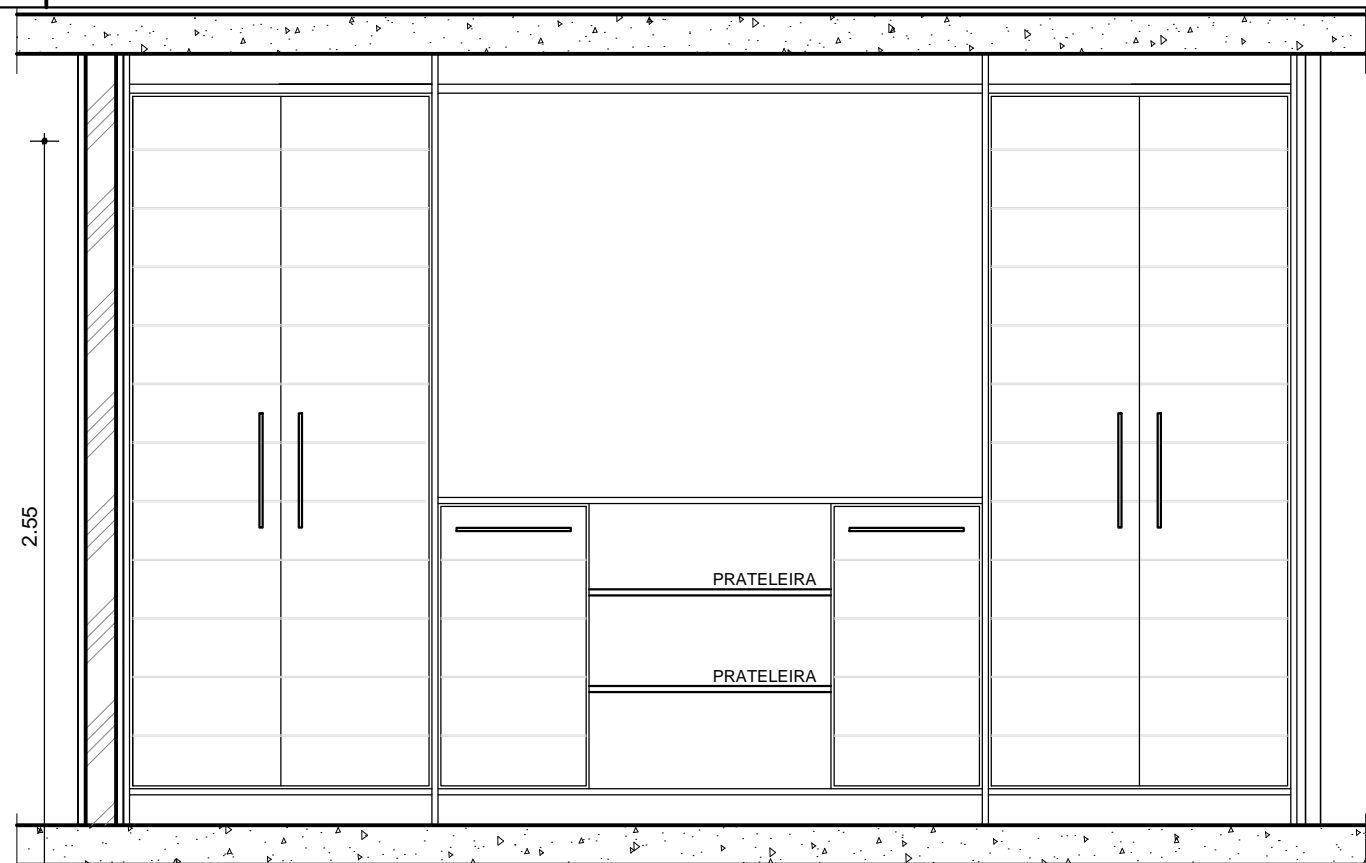
VISTA EXTERNA ESCALA 1/25